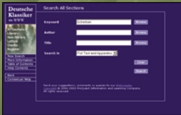
Sophisticated search options help pinpoint specific information