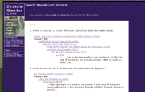
The Search Results page offers researchers various resources based on their search criteria